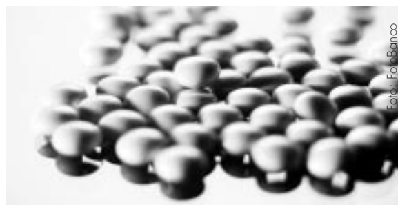
El Consejo de la UE ha seleccionado cuatro nuevas drogas sintéticas para que se proceda a la evaluación de sus riesgos.

El nuevo logotipo pretende ser actual, serio y fidedigno. El mantenimiento de los colores, estrellas y elementos simbólicos del anterior logotipo del OEDT recuerda el carácter existente del Observatorio, aunque condensado en un diseño totalmente moderno. El azul oscuro de la izquierda representa los aspectos negativos de las drogas, mientras que el amarillo de la derecha simboliza la esperanza de un futuro mejor. Estas dos mitades están enlazadas por medio del símbolo universal de la unidad y la confianza, el arco, que lleva a cabo su propia transformación de lo negativo a lo positivo. Alrededor de todo ello se encuentran las 12 estrellas unificadoras de la bandera de la UE.