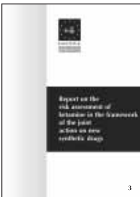
Report on the risk assessment of ketamine in the framework of the joint action on new synthetic drugs.

Para más información sobre todas las publicaciones del OEDT y detalles sobre cómo solicitarlas, diríjase a la página Web del OEDT en http://www.emcdda.org/infopoint/publications.shtml